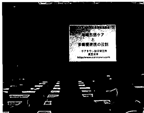
「地域包括ケアシステム」研修