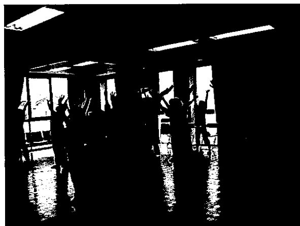
網代フレッシュサロン