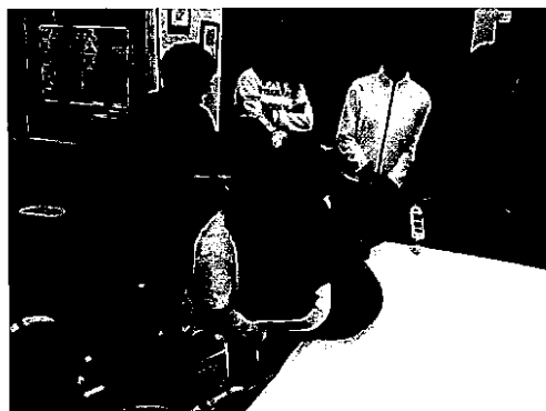
「介助におけるキネスティック」研修