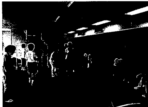
サマーショートボランティア